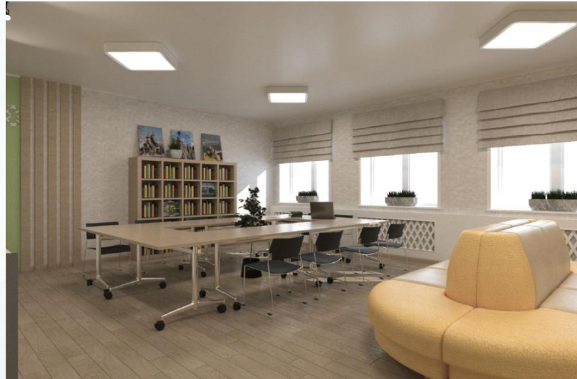
ПРОЕКТ МОДЕЛЬНОЙ БИБЛИОТЕКИ В С. ТУРОЧАК