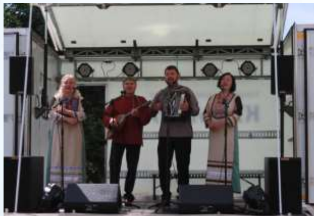
МО «Турочакский район»