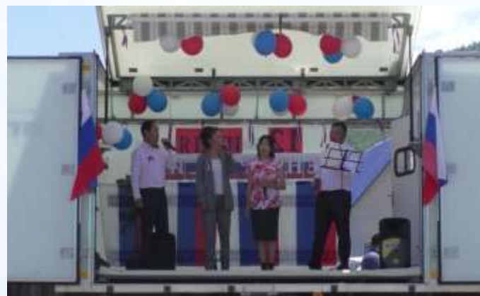
МО «Усть-Канский район»