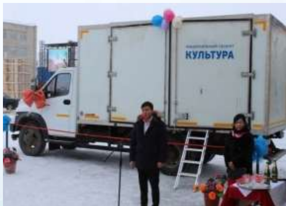
МО «Кош-Агачский район»

34 ВЫЕЗДНЫХ МЕРОПРИЯТИЯ ОХВАТ НАСЕЛЕНИЯ - 13 104 ЧЕЛОВЕК