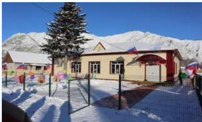
с. Усть-Кумир, Усть-Канский район

Общий объем финансирования 45 млн.руб. (ФБ – 38,2 млн.руб.)