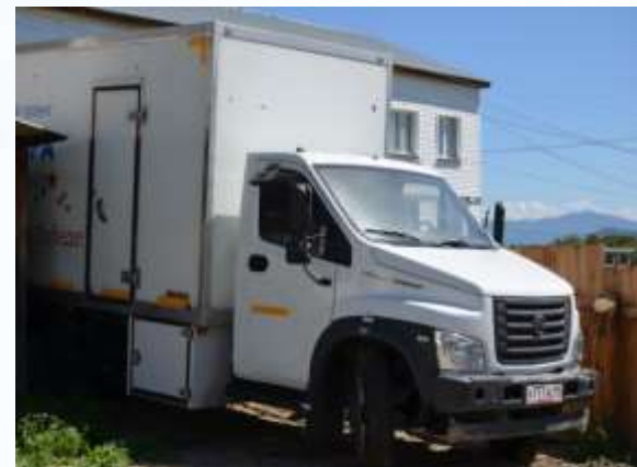
МО «Усть-Коксинский район»