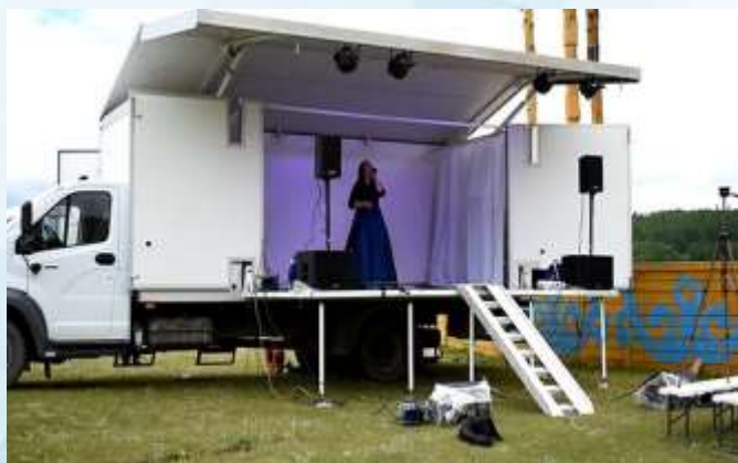
МО «Улаганский район»