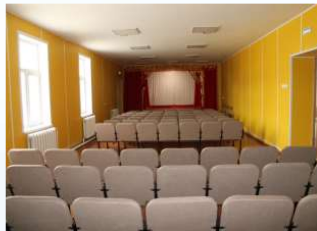
с. Теленгит-Сортогой, Кош-Агачский район