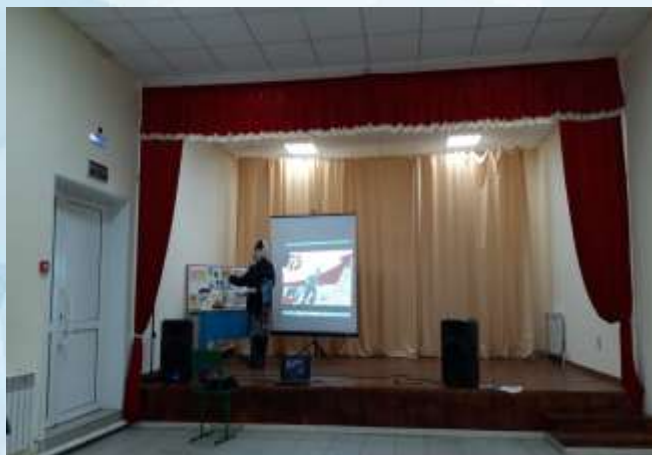
с. Купчегень, Онгудайский район