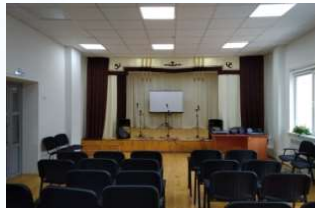
с. Каспа, Шебалинский район