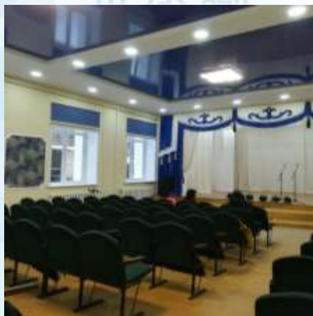
с. Анос, Чемальский район